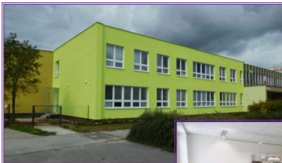
Fotka č. 1 – rekonstruovaný pavilon

Nyní již k dokončení rekonstrukce chybí poslední část. Pravá část pavilonu CF2 a pavilon CF1. I na tuto část je již zpracován projekt a pevně věříme, že samotná realizace začne v roce 2018.