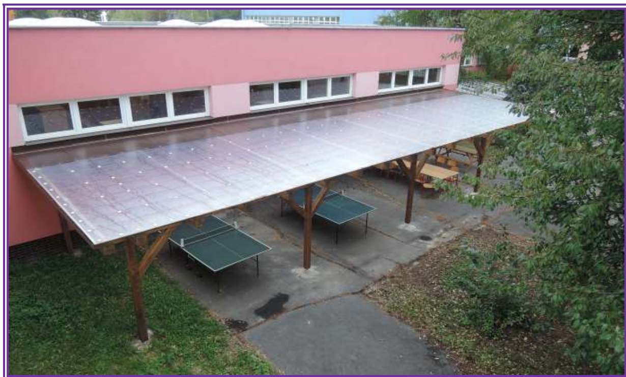
Fotka č.3 – zastřešená pergola v atriu

Na podzim roku 2016 byla vybudována zastřešená pergola v atriu školy, která bude sloužit nejen družině k volnočasovým aktivitám (pingpong, kreslení...), ale také jako venkovní učebna využívaná za dobrého počasí. Významným finančním příspěvkem se na realizaci pergoly podíleli samotní žáci školy a to díky výtěžku sběru papíru.