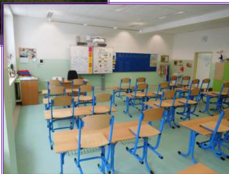
Fotka č. 2 – nová třída 1.A