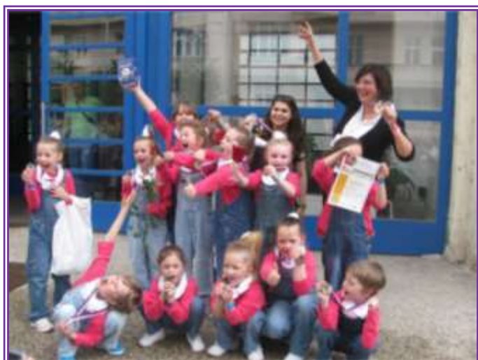
Fotka č. 4 – TYK TAK formace Back in the game